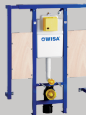
WISA XS L WC Front met steunbeugelelementen art.nr. 8050452737