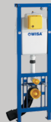
WISA XS WC Vario art.nr. 8050452735

Tijdens de ontwikkeling van deze producten is WISA bijgestaan door een uitgebreid installateurspanel. De praktijkervaring van deze vakmensen leert dat aspecten als installatiegemak, betrouwbaarheid en faalkostenreductie, maar ook efficiënte verwerking en esthetiek een belangrijke rol spelen. Deze kennis, in combinatie met de jarenlange ervaring die WISA heeft op het gebied van spoelsystemen, was de basis voor de ontwikkeling van de producten voor de zorg en utiliteit.