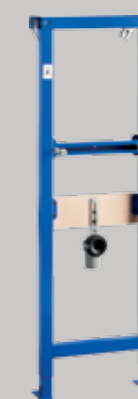
WISA XS wastafelement met inbouwsifon art.nr. 8050452723