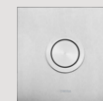
Luga Steel 8050404001

Voor zorg en utiliteitstoepassingen is er breed scala mechanische en pneumatische bedieningspanelen beschikbaar. Speciaal voor bediening op afstand heeft WISA de Solo-knop ontwikkeld. U kunt kiezen voor één of twee Solo-knoppen, gecombineerd met de Luga Steel toets of blindplaat. Speciaal voor Handicare steunbeugels is er een RVS houder beschikbaar waarop de Solo-knop kan worden gemonteerd. Voor extra hygiëne heeft WISA de Argos Antibacterieel. Dit is een bedieningspaneel waarbij het kunststof is verrijkt met zilverionen. De zilverionen zorgen voor een langdurige hygiënische en antibacteriële werking.