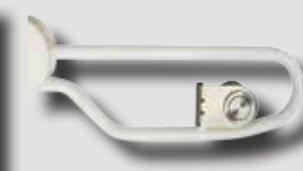
Solo SF knop t.b.v. steunbeugel 8050404401