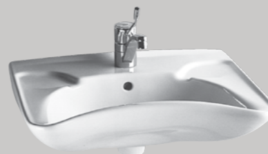
WISA medica wastafel art.nr. 9100901930