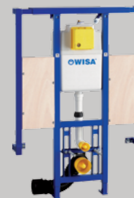
WISA XS L WC Vario met steunbeugelelementen art.nr. 8050452738