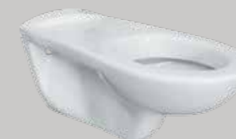
WISA medica wandcloset art.nr. 9100901946