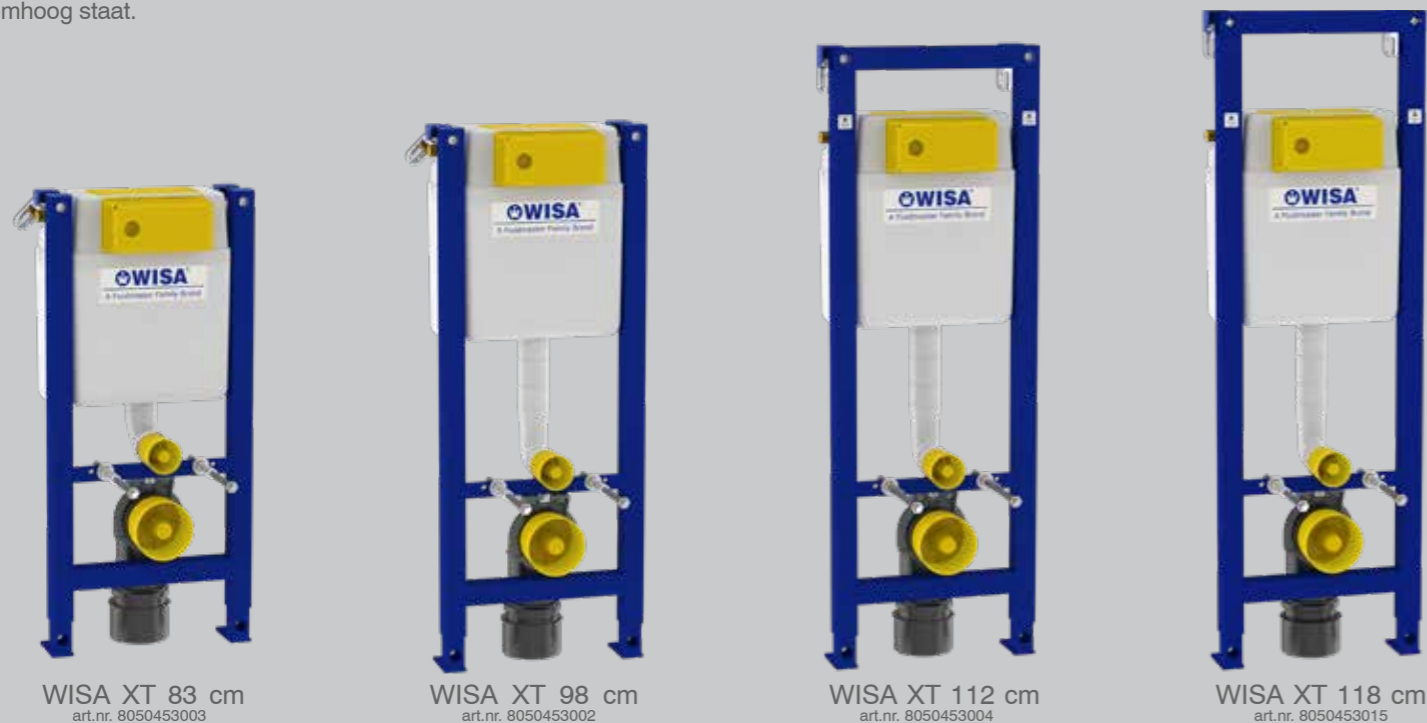
WISA XT 83 cm art.nr. 8050453003

De XT toiletsystemen hebben een breedte van slechts 38 cm en de keuzemogelijkheid tussen top of front bediening en mechanische-, pneumatische of elektronische bediening. De XT toiletsystemen zijn er in vier verschillende hoogtes; 83 cm, 98 cm, 112 cm en 118 cm hoog. De 83 cm variant is ideaal in situaties waarbij onvoldoende inbouwhoogte voor handen is. Bijvoorbeeld onder het raam van een badkamer. Hierbij wordt vaak gekozen voor topbediening. Zo blijft het bedieningspaneel vrij toegankelijk, ook als de deksel van de zitting omhoog staat.